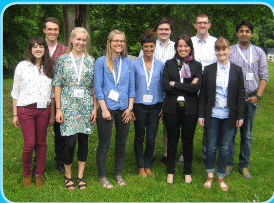
YWPDK Country Chapter Steering Committee

Young Water Professionals Denmark (YWPDK) er et nyligt startet netværk for alle under 35 år, som arbejder eller læser indenfor den danske vandsektor. YWPDK er et uafhængigt netværk under den internationale vandassociation IWA.